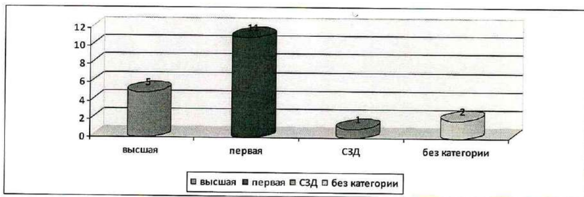
Категорийный уровень педагогов